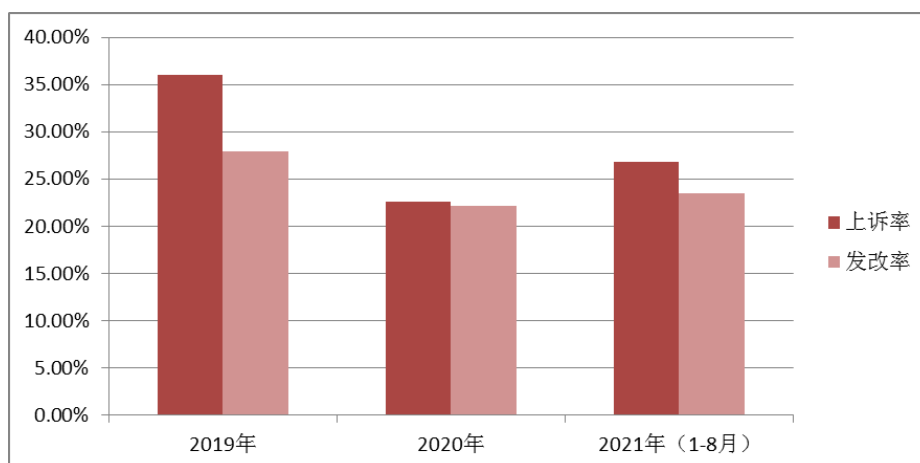
图 2 沙井人民法庭近 3 年交通事故案件上诉率及发改率情况